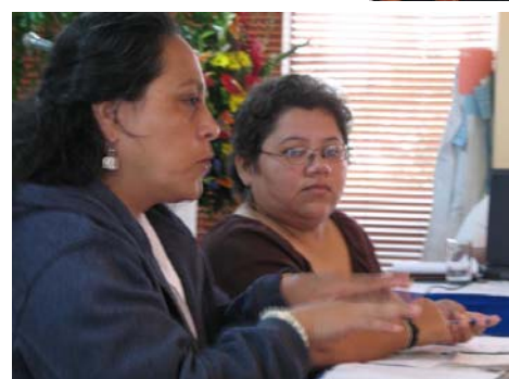
Participantes en el encuentro “Imaginando y Construyendo los Movimientos Feministas hacia el Futuro”